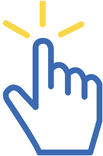
色彩問題を早期に特定