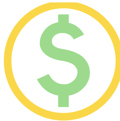
製造コストを抑える