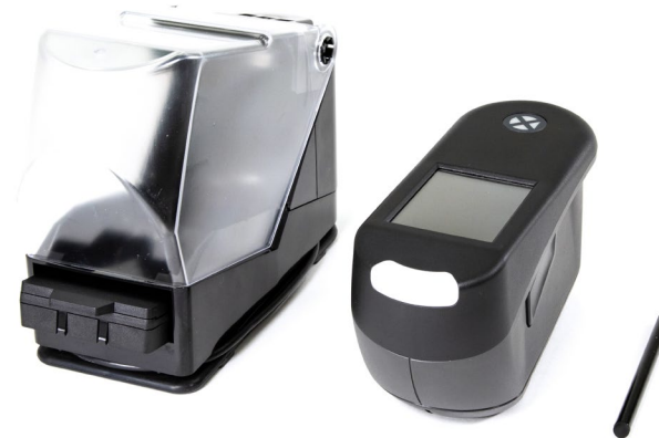
MA-5QC ドッキングステーション